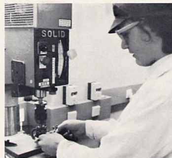
Oben übt ein Schüler an der Säulenbohrmaschine. Zwar klappt es nicht auf Anhieb, aber schließlich ist das Stück doch fertig: Eine Kunststoff-Palette für Reagenzien-Fläschchen.

das, was man hier lernt, auch sonst ganz nützlich ist. Sofern einer nicht zwei linke Hände hat«, fügt sie hinzu.