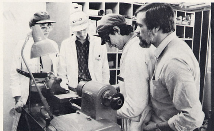
Aller Anfang ist schwer und die Drehbank elend schnell. Deshalb sehen die ersten Holzfigürchen, die hier entstehen, etwas merkwürdig aus. (Bild unten)