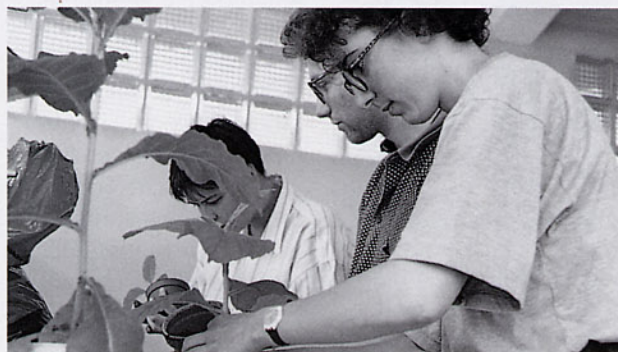
Gärtnerei im Labor: CHF-Schüler züchten Tabak.

ten: Zu der Sicht des Historikers gehörte die Entdeckung des Ozons, der Anorganiker befaßte sich mit seiner Chemie und dem Ozonloch und die Analytikerin mit der klassischen und der modernen Analytik. Die Biologin führte schließlich die physiologische Wirkung des viel diskutierten Stoffes auf die Zelle vor.