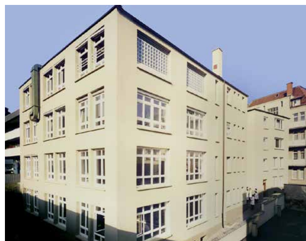
Das Institut Dr. Flad im Stuttgarter Westen

werbs von „Jugend forscht“ oder der „Science Fair“, wie der Wettbewerb auf Englisch heißt.