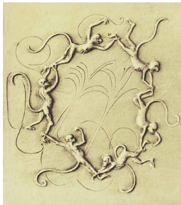
Visionär: Kekulé hatte von einer Horde Affen geträumt, die eine Kette bildeten