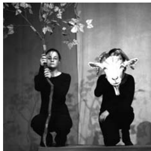
Hexen und Kobolde, ...