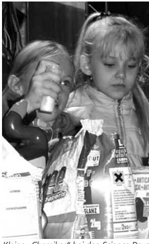
Kleine „Chemiker“ bei den Science Days