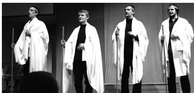
Musikalische Einlagen rundeten das bunte und vielseitige Bild ab

Die Lösung eines der drängendsten Probleme der Welt liegt also auf der Hand. Ob die Weltgemeinschaft sie umsetzen kann und will, wird die Zukunft zeigen. Die Schülerinnen und Schüler des Instituts Dr. Flad jedenfalls haben sicher für die Zukunft wertvolle Anregungen und viel Nachdenkliches mitbekommen, werden sie doch viele der von Wicke beschriebenen Klimaveränderungen sehr wahrscheinlich noch miterleben.