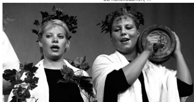
... griechische Philosophinnen ...

eine Retrospektive der Geschichte der Chemie entstanden.