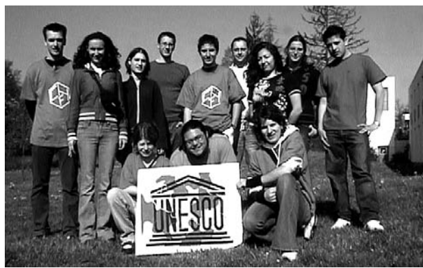
Die Teilnehmer des 5. „Internationalen Tags des Wassers“

Ein von drei Schulen gemeinsam durchgeführtes Projekt war der von der UNESCO ausgeschriebene 5. „Internationale Tag des Wassers“. Vom 24. bis 26. April hieß es für einige Schülerinnen und Schüler des Instituts „Leinen los“. Von Konstanz am Bodensee starteten sie mit einem Motorboot zur Reichenau und ins Wollmatinger Ried, um dort Wasser-