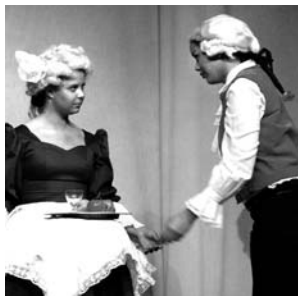
Ob Rokokodamen, ...

Der Schillersaal der Stuttgarter Liederhalle war an diesem 16. Juni bis auf den letzten Platz besetzt. Endlich nahte der große Moment, auf den hin die Schülerinnen und Schüler des Theaterprojektes am Institut ein knappes Jahr hart gearbeitet hatten: Unter dem Titel „Die Chemie muss stimmen“ war