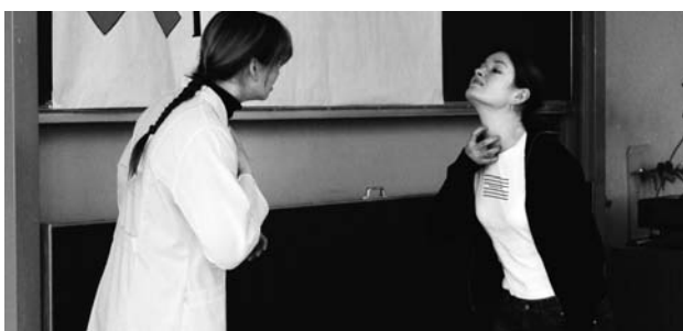
Stumm und gehörlos - da kann Verständigung schwierig sein

Aus dem Projekttag wurde so ein Thema, das sie weiter verfolgen: „Man könnte Beipackzettel in Form von MP3s oder Audio-CDs erstellen oder Medikamentenverpackungen und Einnahmeverordnungen in Braillebeschriftung abfassen“, sind ihre ersten Ideen, um diese Form der Ausgrenzung abzubauen.