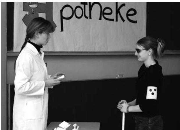
Wer Ausgrenzung hautnah erlebt, geht sensibler mit diesem Thema um