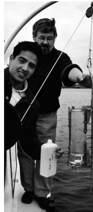
Ob das wohl sauberes Wasser ist?