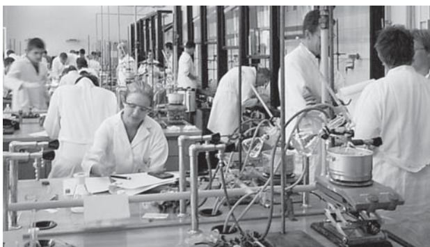
Grand Prix Chimique in Prag 2005

2009 findet zum 10. Mal der internationale Chemie-wettbewerb „Grand Prix Chimique“ statt, der vom Institut Dr. Flad initiiert und aus der Taufe gehoben wurde – damals als Bundesforschungsvorhaben,