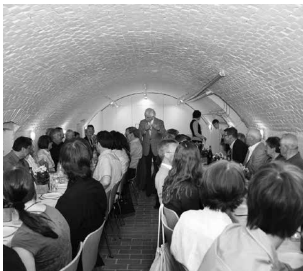
Impression aus dem Theaterkeller